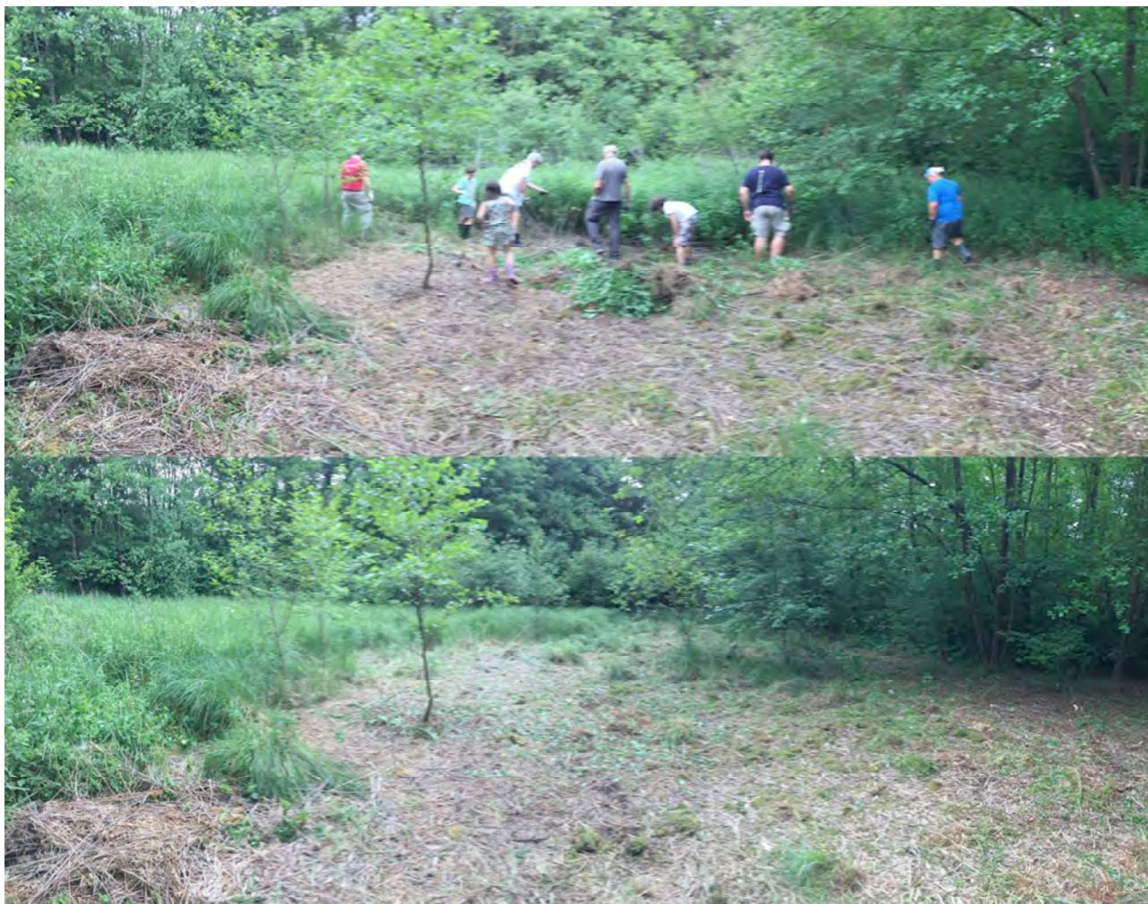
Stanje prej in pozneje 19.6.2019 (področje v ospredju slik je bilo očiščeno 10.6.)

Društvo Slovenski Geocaching klub je v sredo, 19. junija 2019 s svojimi člani opravilo drugo od treh v letu 2019 načrtovanih akcij odstranjevanja zlate rozge z obrobja močvirskega travnika v Mlakah pri Trzinu. Delo smo opravljali v okolici GPS lokacije N 46° 07.820 E 014° 32.981, kjer je več izredno gostih sestojev orjaške in kanadske zlate rozge deloma popolnoma preraščalo vse ostalo avtohtono rastlinje. Deloma smo jih odstranili že med akcijo 10. junija.